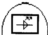
Рисунок 1 — Символ для встраиваемых модулей

h) Встраиваемые модули должны быть маркированы (см. рисунок 1) с целью отличить их от автономных модулей. Маркировку размещают на упаковке или непосредственно на модуле.